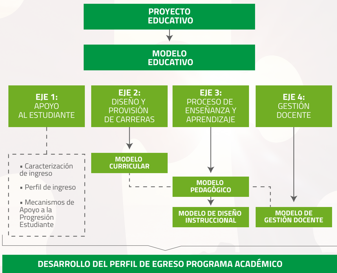
Figura 5-1: Modelos asociados al proceso de formación de estudiantes.

Todos estos elementos son determinados en cuatro ejes del Modelo Educativo: 1) Apoyo al Estudiante, 2) Diseño y provisión de carreras, 3) Proceso de enseñanza-aprendizaje y 4) Gestión docente. Cada eje considera además distintos modelos para su concreción como el Modelo Curricular, el Modelo de Diseño Instruccional (encargados de materializar el Diseño y Provisión de Carreras), el Modelo Pedagógico (que materializa el proceso de enseñanza aprendizaje), y el Modelo de Gestión Docente (que orienta el desarrollo de la Docencia). Todos estos modelos se encuentran articulados y alineados con el PEI, de manera de concretizar el enfoque formativo por resultados de aprendizaje en la totalidad de los programas académicos de IACC, y cuya implementación está contemplada en el proceso de renovación curricular 2017-2022. La implementación de un conjunto de modelos que se encuentran directamente asociados al proceso de formación de los estudiantes se representa en la figura 1.