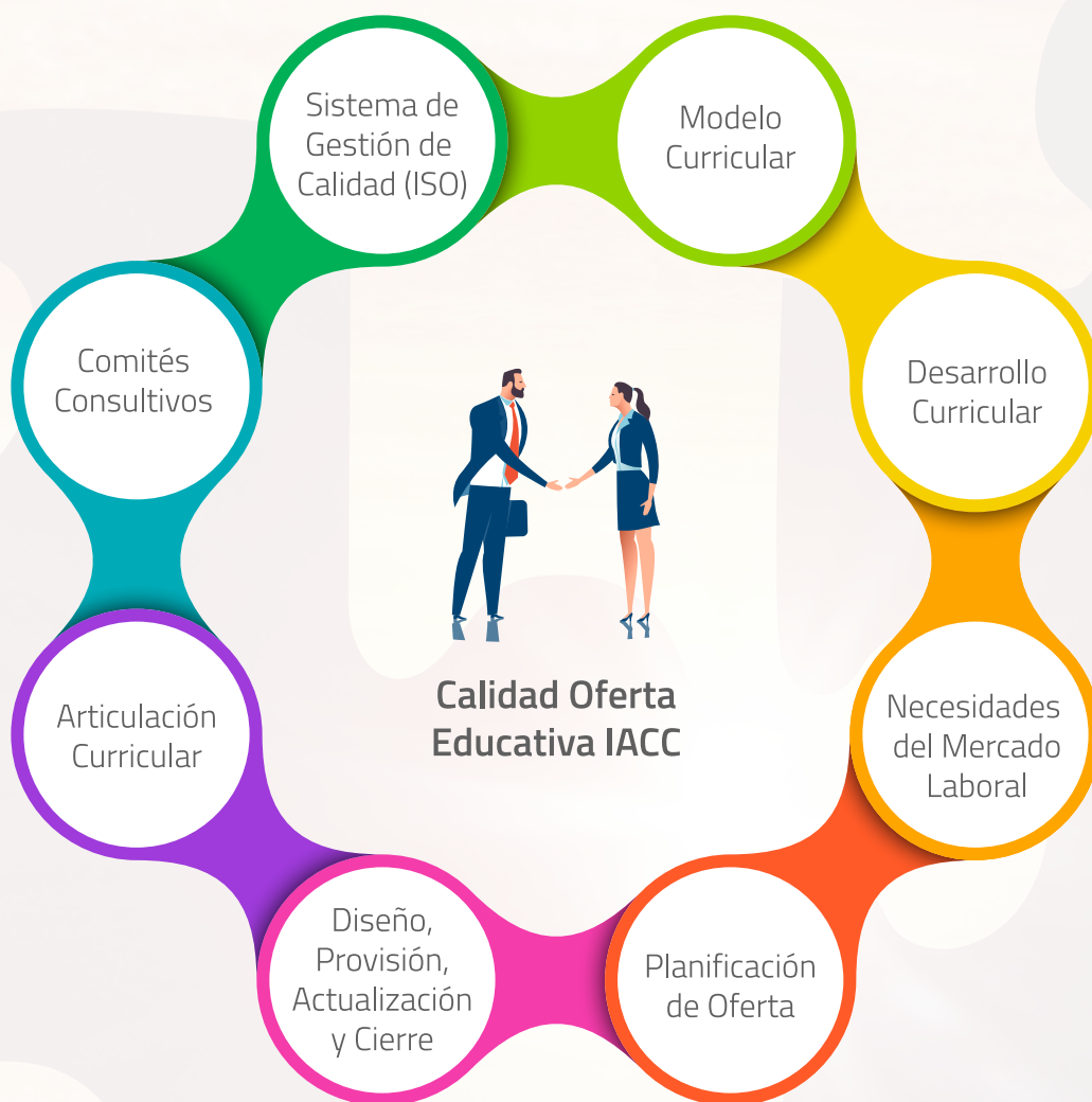
Figura 2: Mecanismos de aseguramiento de la calidad asociados a la oferta educativa de IACC.

Lo descrito se puede graficar de la siguiente forma: